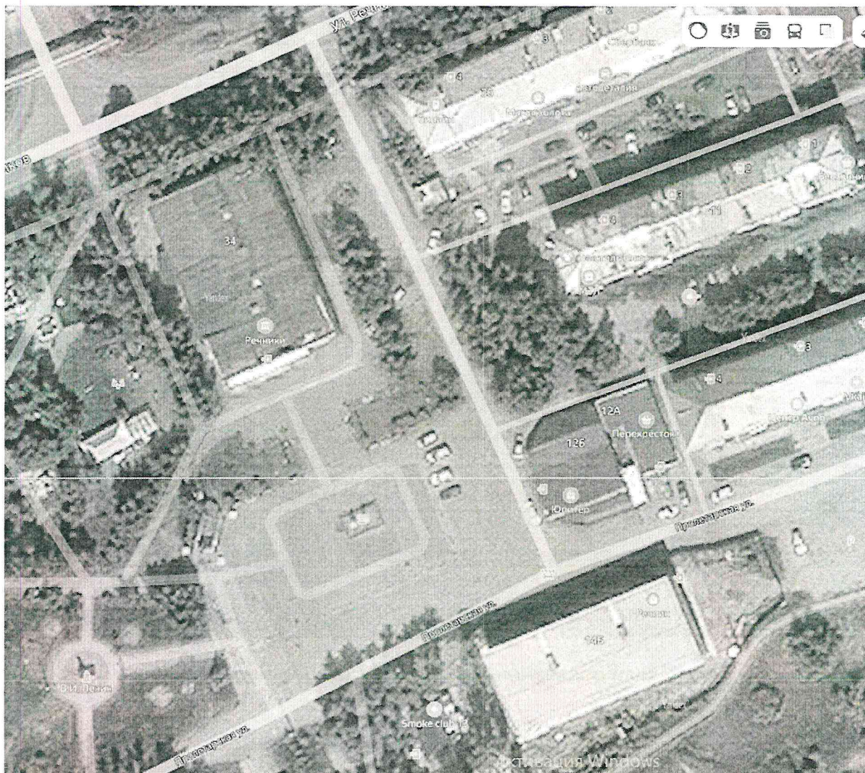
Схема Схема закрытия движения автотранспортных средств во время проведения праздничных мероприятий с 19.00 до 22.00 часов 06.07.2024 года на площади напротив здания МБУК «ДК Речники» УКМО (гп) в городе Усть-Куте

Примечание: – места закрытия движения автотранспорта