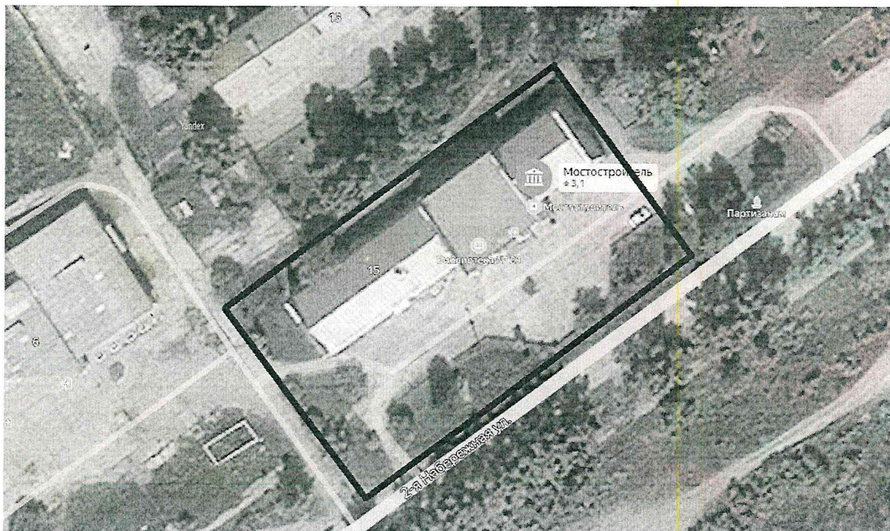
Схема границ территории проведения праздничного мероприятия на площади МКУК «Межпоселенческий КДЦ» УКМО

Условные обозначения: _____ граница праздничного мероприятия