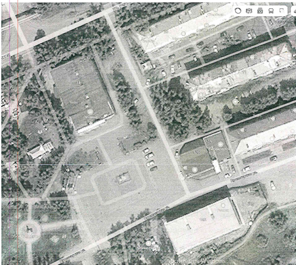
Схема Схема закрытия движения автотранспортных средств во время проведения праздничных мероприятий с 19.00 до 21.00 часов 12.06.2024 года на площади напротив здания МБУК «ДК Речники» УКМО (гп) в городе Усть-Куте

Примечание: – места закрытия движения автотранспорта