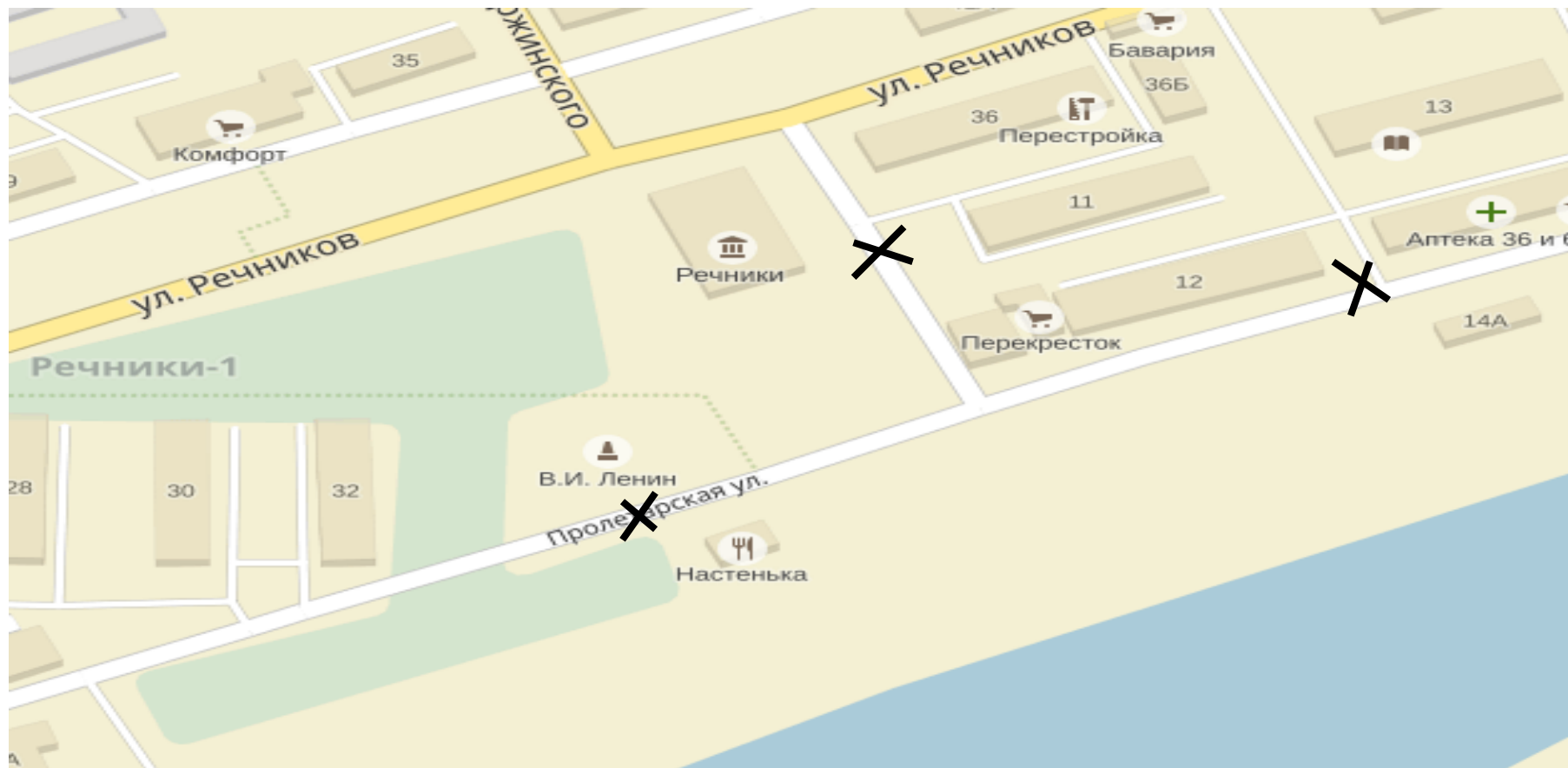
Схема ограничения дорожного движения во время проведения праздничного концерта на площади МБУК ДК «Речники»

Приложение № 6 к постановлению администрации муниципального образования «город Усть-Кут» от 26.04.2018г. № 387-п